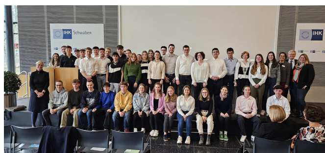
Gruppenbild: Preisträger P-Seminarpreis 2024

Als besonders erfreulich kann an dieser Stelle noch hervorgehoben werden, dass das Illertal-Gymnasium Vöhringen nicht nur auf schwäbischer Ebene zu den drei Bezirkssiegern gehört, sondern auch auf Landesebene zu einem der vier besten P-Seminare in ganz Bayern gewählt wurde. Im Rahmen eines Festaktes wurde das Illertal-Gymnasium Vöhringen aufgrund herausragender Leistungen von Kultusministerin Anna Stolz belobigt und durfte auch die bayernweite Auszeichnung entgegennehmen. Herzlichen Glückwunsch!